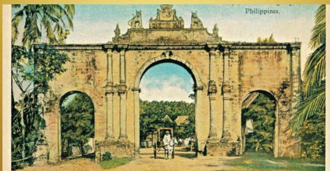
Puerta Real en la entrada de la ciudad de Pagsanjan, Filipinas. Composición de tres arcos de medio punto con pilastras en dos niveles y un remate central con el escudo real y dos figuras escultóricas de felinos en ambos costados. Al centro una calesa tradicional con caballo