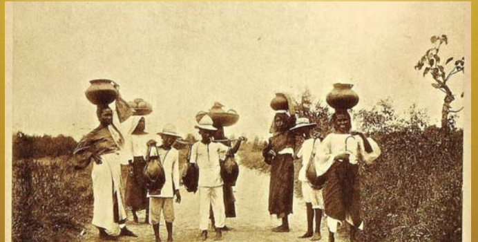
Conjunto de campesinos en un camino de tierra, las mujeres portan ollas de barro sobre sus cabezas y canastas con productos y los hombres y jóvenes porteadores de agua en ollas de barro de boca angosta, todos ellos con ropa de algodón blanca y de color sin calzado