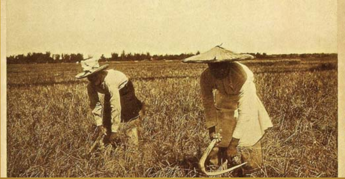
Campeños en el corte de arroz con sus herramientas de trabajo, traje de campo y sombreros, al final del siglo XIX