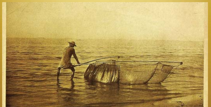
Pescador con redes en la orilla de una playa y una vara para su ejecución