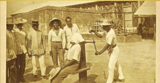
Grupo de hombres en una hacienda en el campo con uno de ellos sedente en un instrumento de tortura en el cuello llamado "garrote", que debió ser una forma de castigo o de ejecución local en las regiones rurales