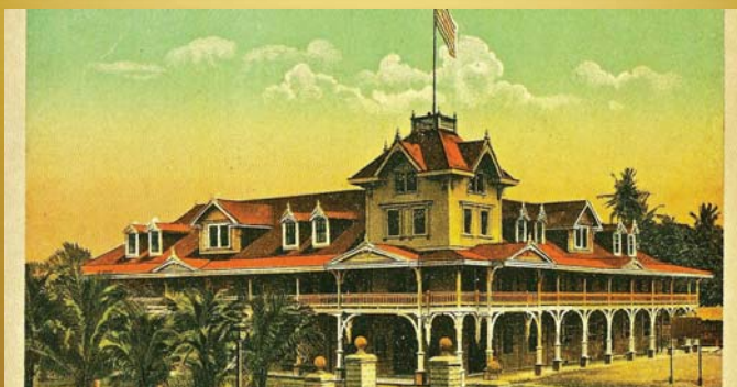
Instituto Silliman, edificio de arquitectura de madera con pórticos en ambos niveles, cubiertas a dos aguas, lucarnas en la cumbre y torre mirados en la esquina del inmueble con cinco niveles y la bandera de Estados Unidos, durante la administración de este país en Filipinas