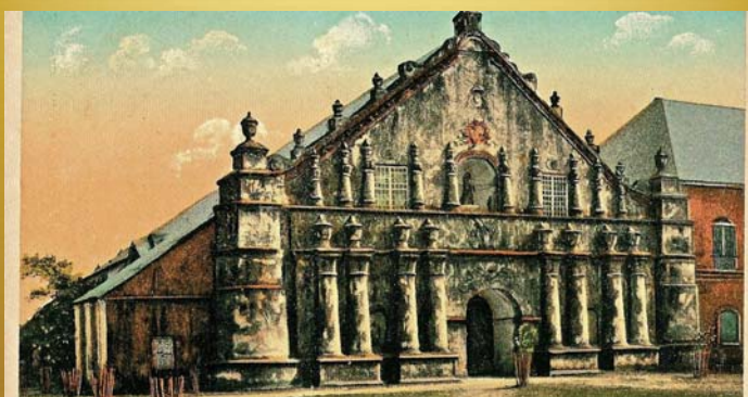
Portada principal del templo colonial de gran masividad con pilastras en dos cuerpos nicho central y ventanas del coro con un caballete para su cubierta a dos aguas, los contrafuertes circulares de las esquinas forman parte de su estructura ubicado en la ciudad de Laoag, Ilocos Norte isla de Luzón, Filipinas