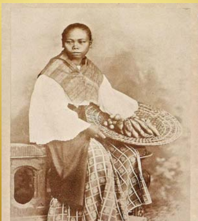
Mujer asiática y de color con su traje tradicional y cesta con plátanos